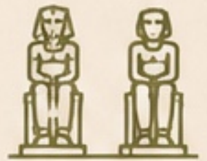
COLOSOS DE MEMNÓN