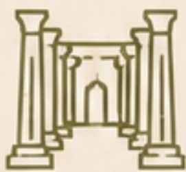
TEMPLO DE LUXOR