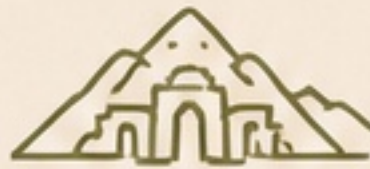
VALLE DE LOS REYES