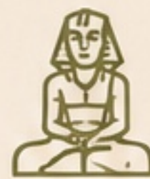
TEMPLO DE HATSHEPSUT