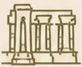
TEMPLO DE KARNAK