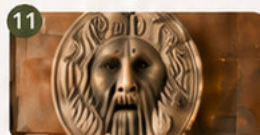
Bocca della Verità

El barrio ideal para pasear, cenar y vivir una Roma más auténtica.