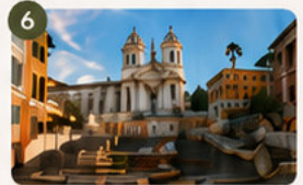
Piazza di Spagna

Plaza barroca con fuentes monumentales y un ambiente muy especial.