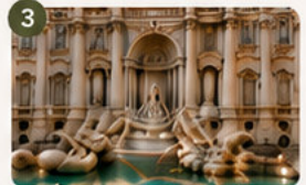
Fontana di Trevi

El corazón arqueológico de la antigua Roma, lleno de historia y ruinas monumentales.